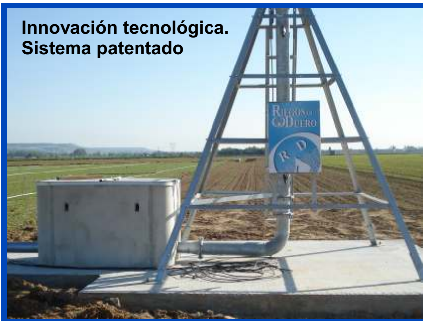
Innovación tecnológica. Sistema patentado

El ECO-HIDROGENERADOR propone una nueva alternativa para el accionamiento del sistema utilizando como fuente de energía el exceso de presión de la red para el funcionamiento del Pivot. (Energía coste “0”).